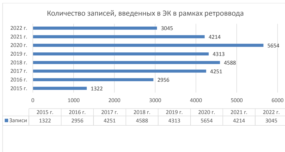
Рис. 2. Количество записей, введенных в ЭК в рамках ретроввода

В 2022 году работа в данном направлении велась в рабочем режиме.