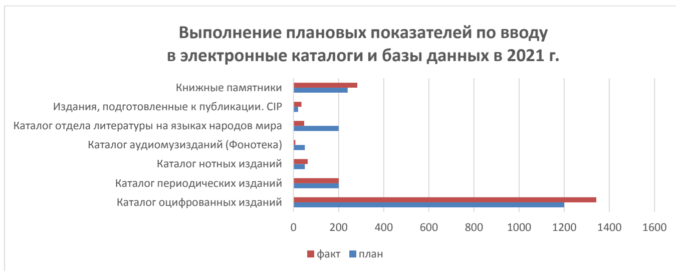
Рис. 1. Выполнение плановых показателей в 2021 г. по вводу в электронные каталоги и базы данных библиотеки

Можно отметить, что плановые показатели по вводу в электронные каталоги и базы данных библиотеки в 2021 г. выполнены практически на 100%.