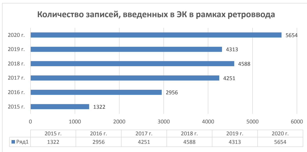
Рис. 2. Количество записей, введенных в ЭК в рамках ретроввода

В 2020 году работа в данном направлении велась в рабочем режиме.