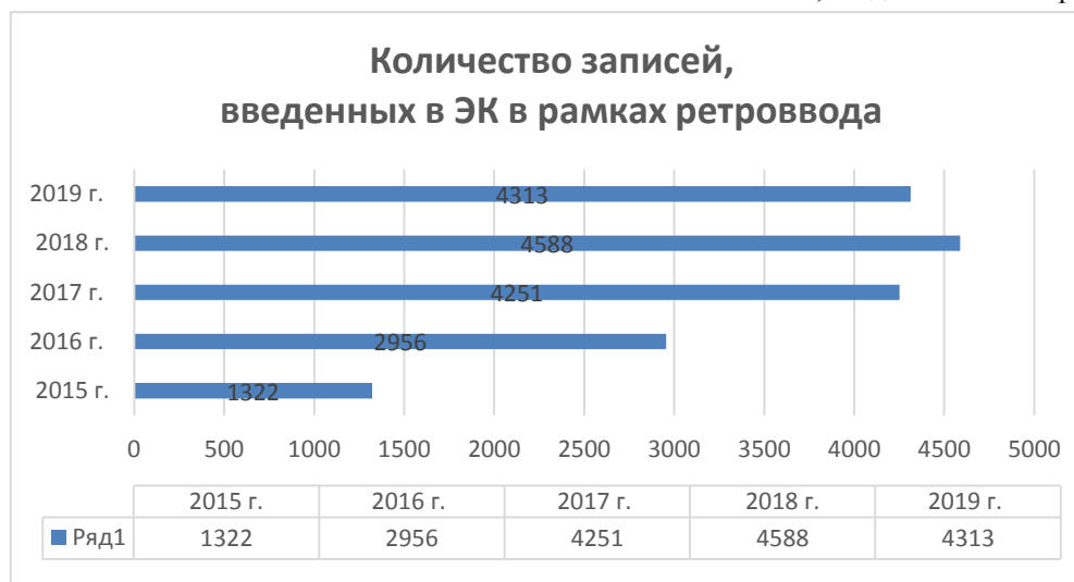
Рис. 2. Количество записей, введенных в ЭК в рамках ретроввода

Работа с карточными каталогами и картотеками велась в текущем режиме. Выполнение плановых показателей по расстановке карточек в традиционные каталоги отражено в табл. 4 и рис.4.