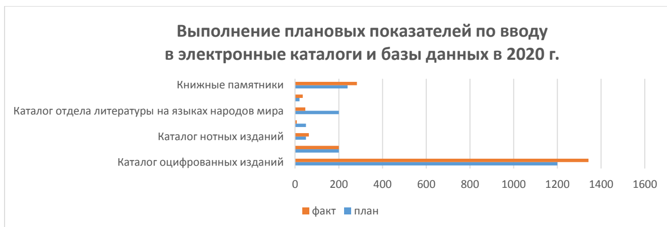
Рис. 1. Выполнение в 2020 г. плановых показателей по вводу в электронные каталоги и базы данных библиотеки

Можно отметить, что плановые показатели по вводу в 2020 г. в электронные каталоги и базы данных библиотеки выполнены практически на 100%.