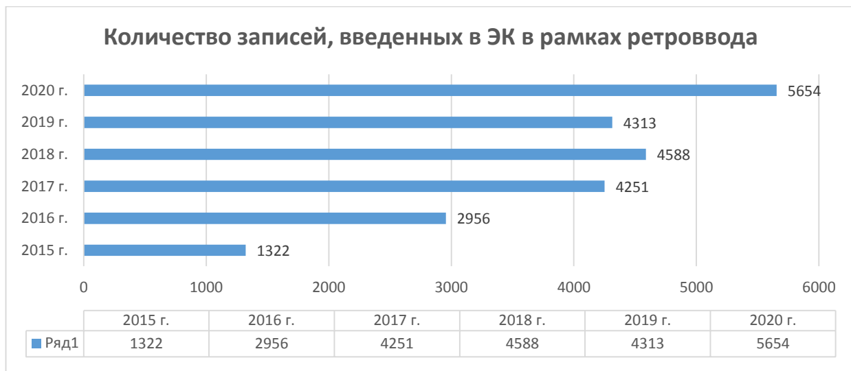
Рис. 2. Количество записей, введенных в ЭК в рамках ретроввода

Работа с карточными каталогами и картотеками велась в текущем режиме. Выполнение плановых показателей по расстановке карточек в традиционные каталоги отражено в табл. 4 и на рис.4.