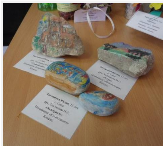
Титлянова Юлия, 13 лет, с. Сива Роспись на камнях Используемые материалы: камни, акриловые краски.