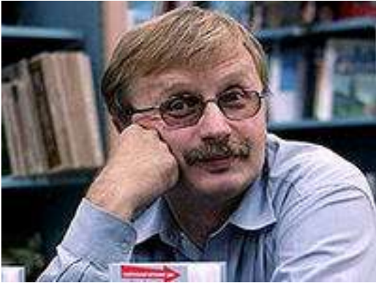
Бояшов Илья Владимирович (р. 1961), русский писатель, преподаватель истории

Книга вошла в шорт-лист премии «Национальный бестселлер» 2009 г. Фэнтези о схватке русского танкиста и немецкой чудо-машины – танка «Белый тигр».