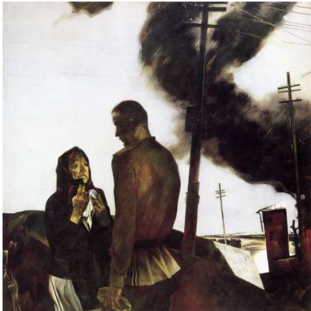
Прощание, Мыльников А. А. 1975 г.