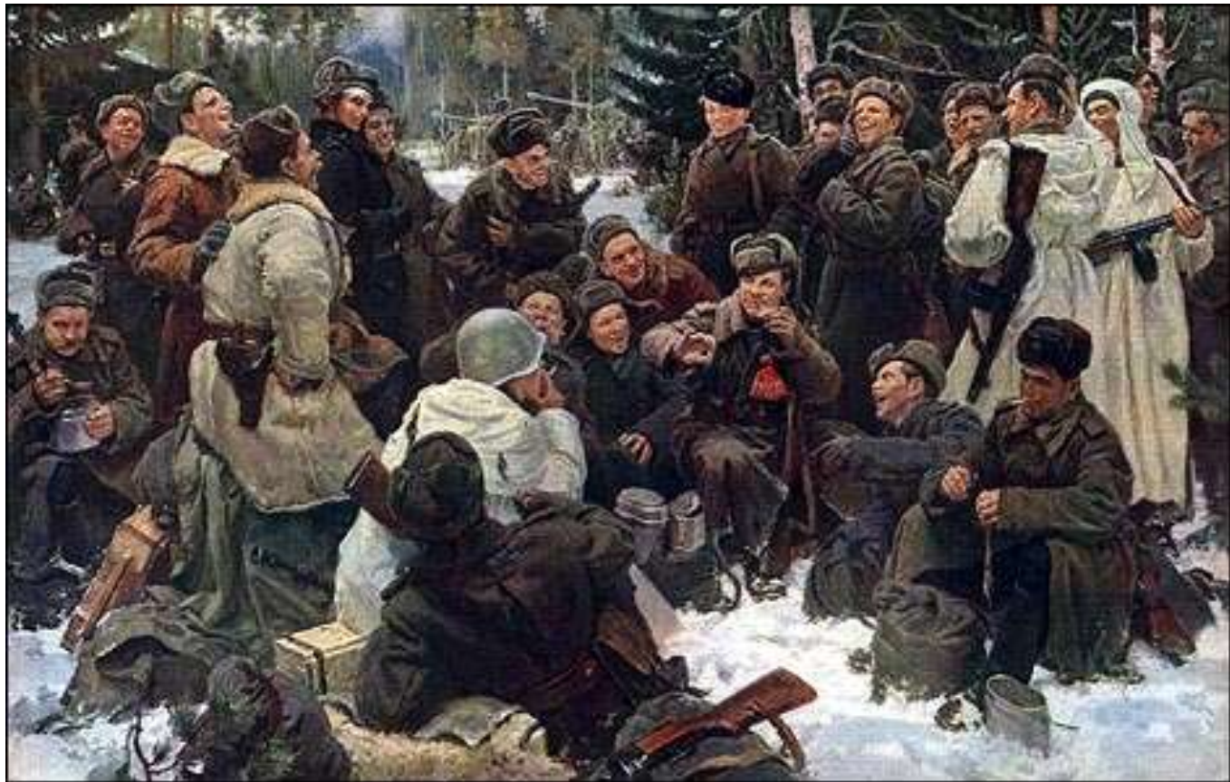
Отдых после боя, Непринцев Ю. М. 1955 г.

Прообразом для картины стала поэма Александра Твардовского “Василий Тёркин”