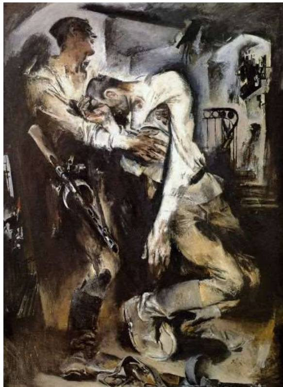
Победа, Моисеенко Е. Е. 1972 г.