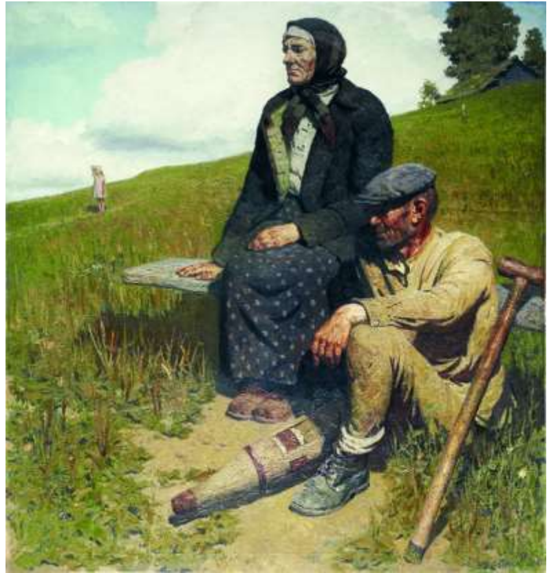
Облака, 1945, Коржев Г. М., 1985 г.