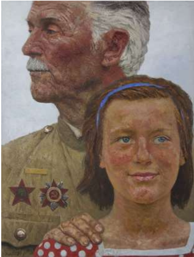
Тревога (Из серии “Опаленные огнем войны”), Коржев Г. М., 1968 г.