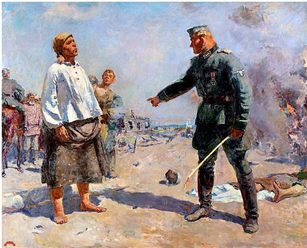
Мать партизана, Герасимов С. В. 1943 - 1950 гг.