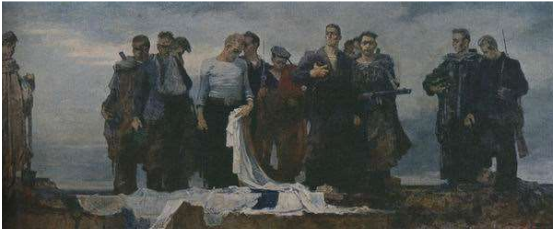
Клятва балтийцев, Мыльников А. А. 1946 г.