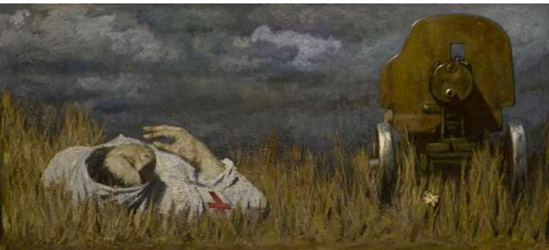
После боя, Коржев Г. М., 1988 г.