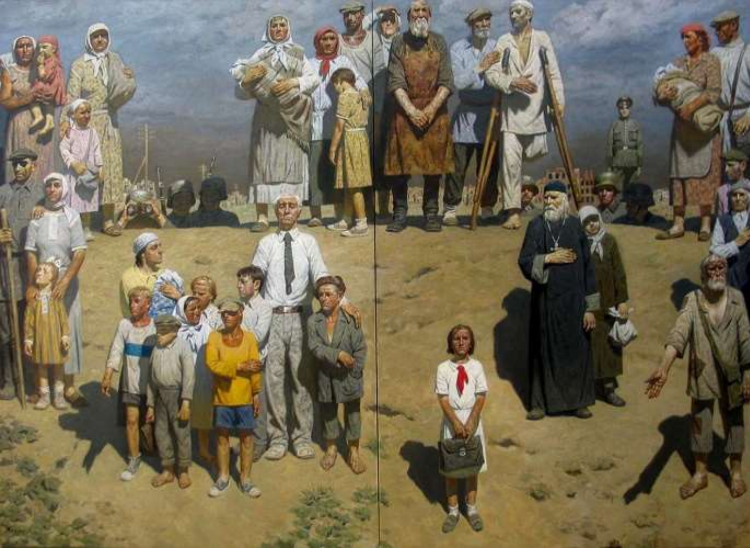
Заложники войны, Коржев Г. М., 2005 г.