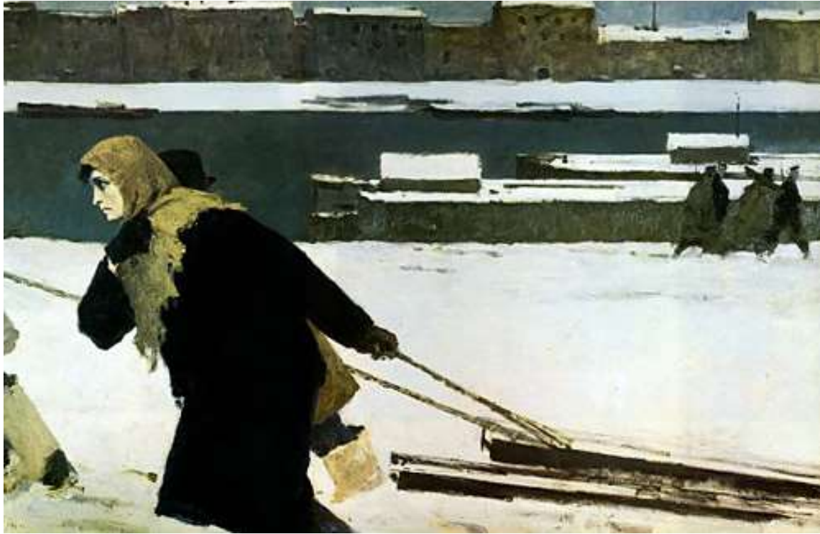
Ленинградка (В сорок первом), Угаров Б. С. 1961 г.

«Мы двигались к передовой, а навстречу нам шли ленинградцы, возвращавшиеся с рытья окопов, в основном это были женщины...»