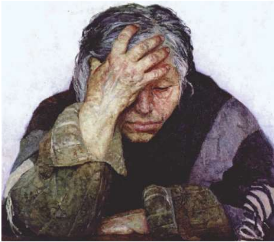
Мать (Из серии "Опаленные огнем войны"), Коржев Г. М. 1967 г.