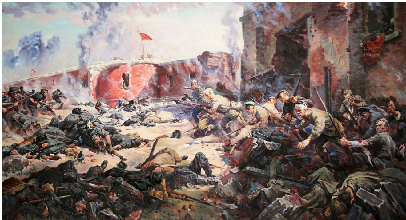
Защитники Брестской крепости, Кривоногов П.А. 1951 г.

На картине запечатлен момент боя у Тереспольских ворот Брестской крепости, когда оставшиеся в живых пограничники вновь идут в очередную контратаку.