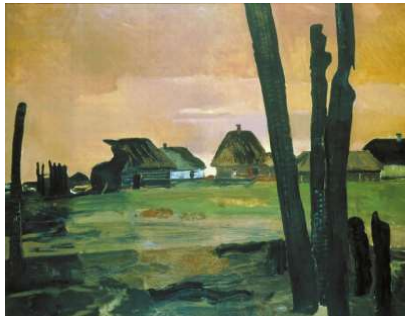
Сгоревшая деревня, Дейнека А. А. 1942 г.