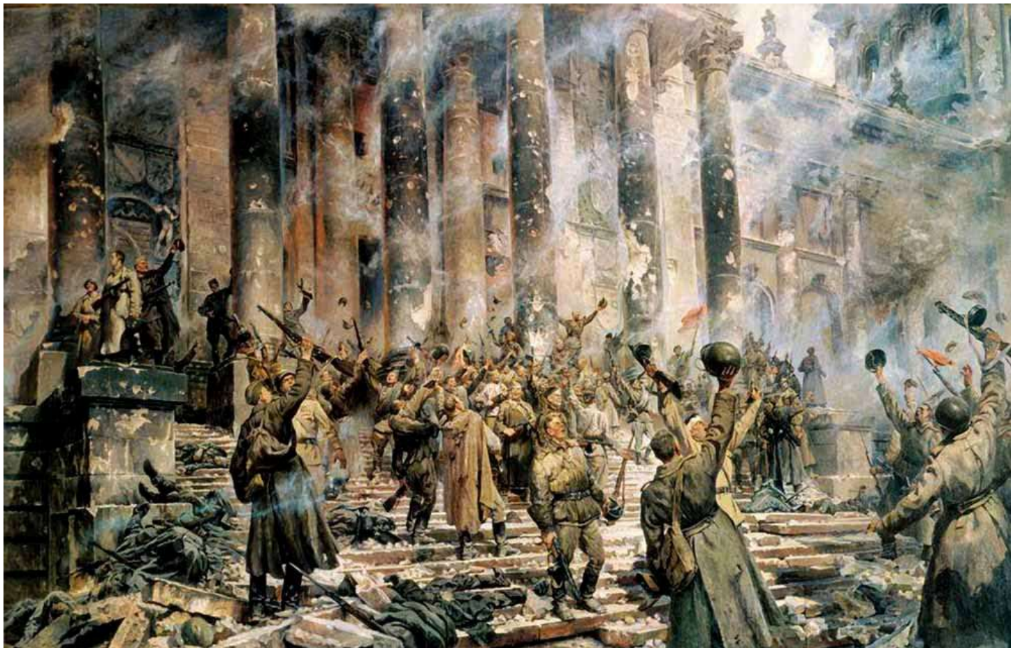
Победа, Кривоногов П. А. 1948 г.