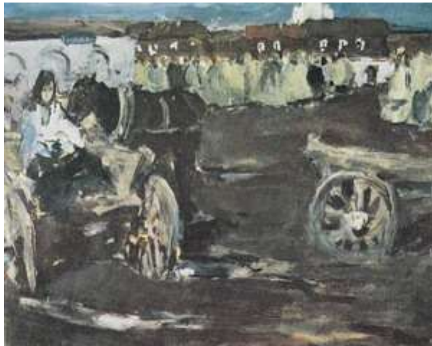
Июнь. 1941 года, Угаров Б.С. Эскиз, 1974 г.