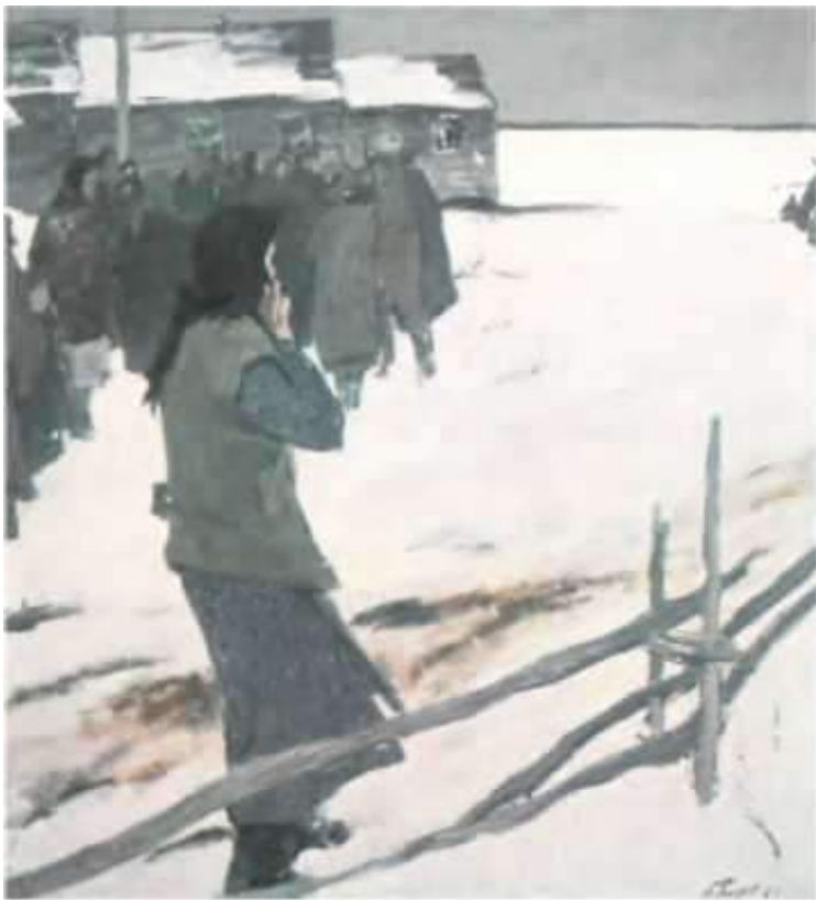
Мать. 1941 год, Угаров Б. С. 1975 г.