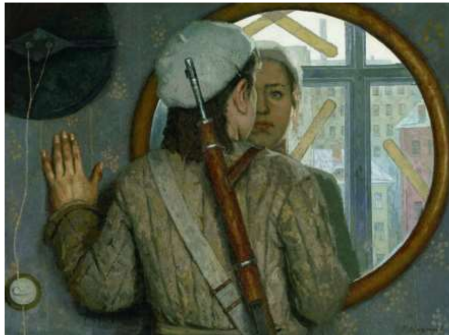
Перед дальней дорогой, Коржев Г. М., 1976 г.