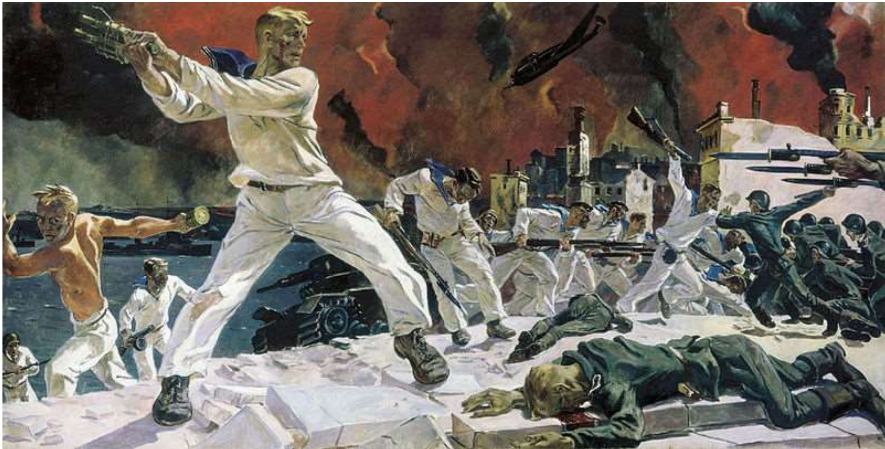
Оборона Севастополя, Дейнека А. А. 1942 г.