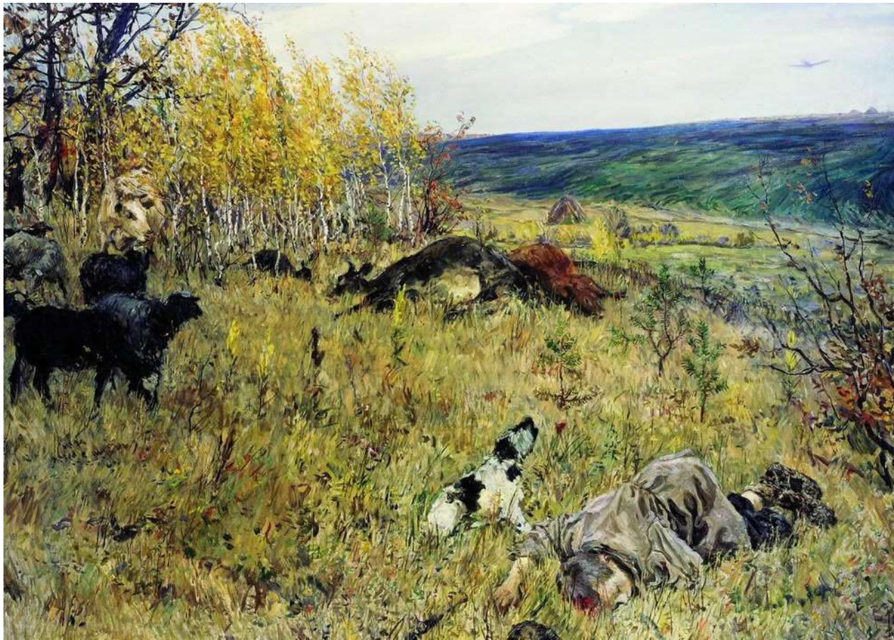
Фашист пролетел, Пластов А. А. 1942 г.

В 1943 году это полотно висело в зале советского посольства в Тегеране во время проведения совещания лидеров СССР, США и Великобритании.