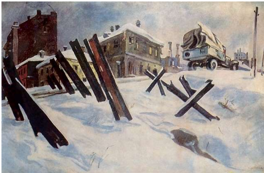
Окраина Москвы. Ноябрь 1941 года, Дейнека А. А. 1941 г.