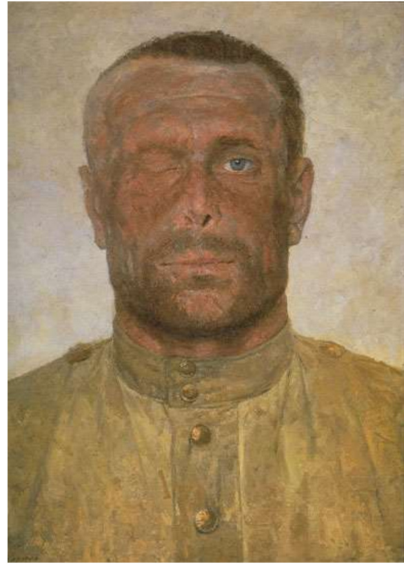
Следы Войны (Из серии "Опаленные огнем войны"), Коржев Г.М. 1963-64 г.