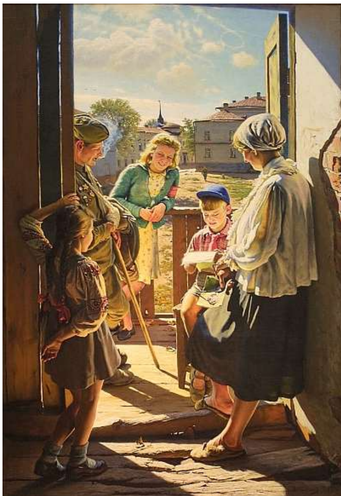
Письмо с фронта, Лактионов А. И. 1947 г.

В 1943 году художник повстречал солдата, несшего письмо сослуживца его семье. Солдат, опираясь на палку, с плащ-палаткой через плечо, увидев Лактионова, подсел и попросил помочь найти нужный ему адрес. Художник тут же предложил его провести. Лактионов привел бойца к нужному дому и увидел, как того сразу же обступили родные друзья, как доставали письмо, читали, боялись пропустить даже слово.