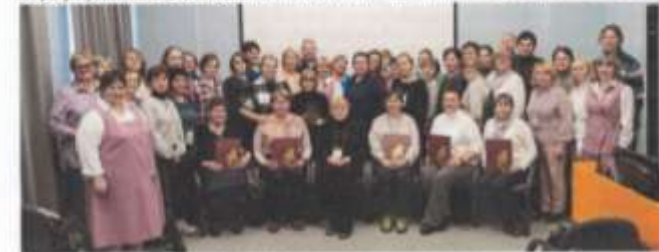
В Детской библиотеке Кунгурска 23 октября

Для ведущих специалистов библиотек Пермского края конференция стала хорошим поводом для профессионального диалога и актуализации вопросов, которые требуют дальнейшего разрешения. Библиотечные фонды – это культурное, образовательное наследие, генерирующее из поколения в поколение и создающее новый информационный контент территории. Работа по формированию фондов всегда являлась генеральным направлением в работе библиотек любого уровня, и разговор о фондах библиотек – это серьезное и важное размышление о будущем нашей страны.